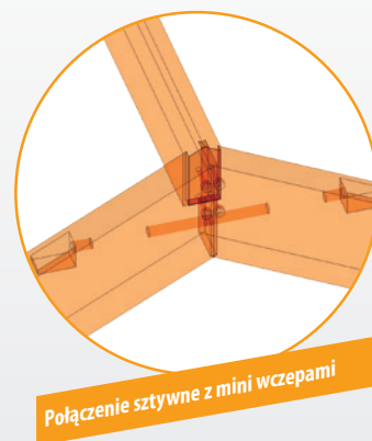
Połączenie sztywne z mini wczepami